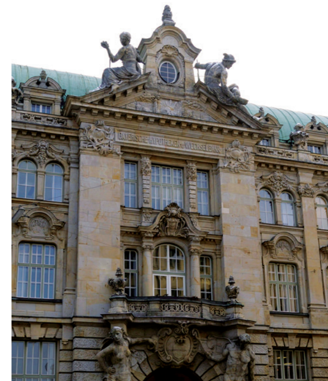
Die Kanzlei Weiss Walter Fischer-Zernin liegt in Münchens historischem Zentrum, in bester Lage zwischen Maximiliansplatz und Theatiner Straße.

Kanzlei Weiss Walter Fischer-Zernin Rechtsanwälte • Wirtschaftsprüfer • Steuerberater Kardinal-Faulhaber-Straße 10 D-80333 München Tel.: +49 (0)89 290719-29 Fax: +49 (0)89 290719-17 E-Mail: e.engbers@rae-weiss.de www.rae-weiss.de